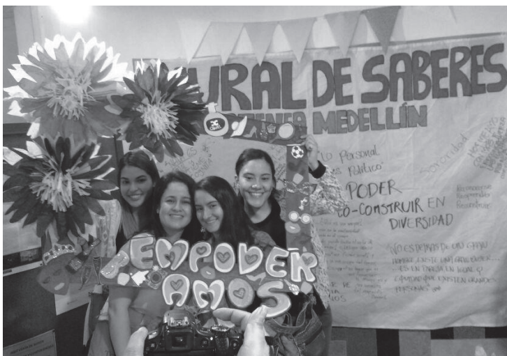
Fuente: Fonnegra, Jenifer. Grados en la Escuela Atenea. En Incidencia política, género y trata de personas (2017)