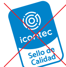
No reproducir el logotipo inclinado