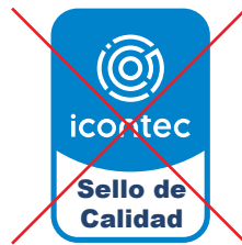
No alterar la tipografía