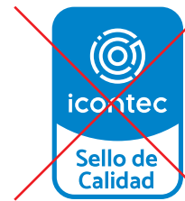
No ubicar el referencial verticalmente

Referencial y nombre de producto, o alcance del proceso ó servicio.