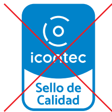
No eliminar elementos