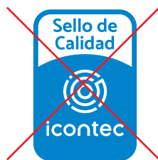
No alterar el orden de los elementos