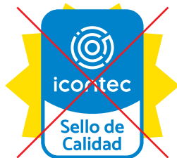
No invadir el fondo con elementos gráficos