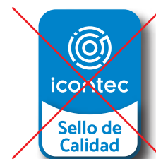
No aplicar sombreado o efectos gráficos