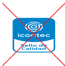
No cambiar las proporciones y no distorsionar

Referencial y nombre de producto, o alcance del proceso ó servicio.