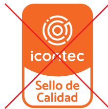
No alterar el color